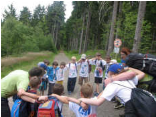
P. S.: Více fotek na facebooku SHM Počernice

ostřílení kovbojové. Třináctiletí se ocitli v temných zákoutích Palerma... Vrátili se všichni, tak asi obstáli... Nejstarší kluci si to namířili přímo do Tater. Přešli je za týden a vůbec jim nevadilo, že jsou Nízke.