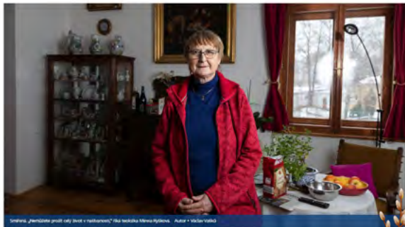
Smířená „feminizace prošli celý život v zastavení“ řád kněžství Mireia Ryšková. Autor: • Věsta Váňková

Vladimír Ševela interview 28. 1. 2023 20:04 • Aktualizováno • 15 minut čtení • PŘEHLED ČLÁNKŮ